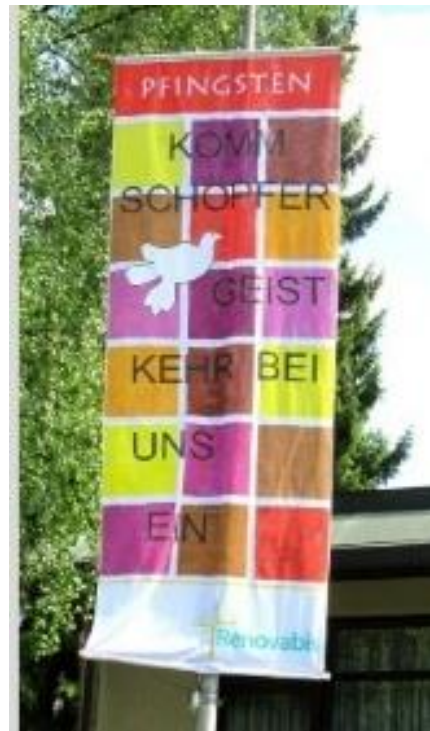
Gottes Geist bewegt! Komm feiere mit!