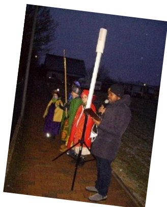
Unser Pfarrvikar: 2022 mit den Sternsängern unterwegs