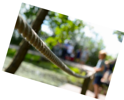
Beichte - Ich halte mich fest an Gott ...

D ie Vorbereitung für die Sakramente der Versöhnung und der Eucharistie in der Pfarrgemeinde St. Antonius – St. Wolfgang in Kümmersbruck ist ein Angebot der „Kirche vor Ort“ – besonders für die Schüler/innen in der 3. Klasse.