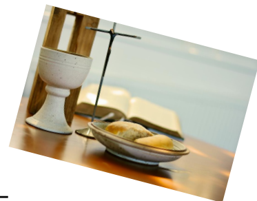
Kommunion – Ich erlebe Gemeinschaft mit IHM ...

E s ist uns ein Anliegen, zusammen mit den Eltern, die Schüler/innen „an der Hand nehmen“ und sie bei ihrer persönlichen „Suche nach Gott“ zu begleiten.